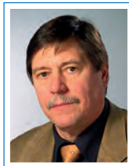
Anton Erhard Federal Institute for Materials Research and Testing, Berlin